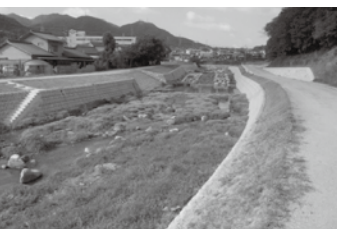
河川改修工事 (広島県)