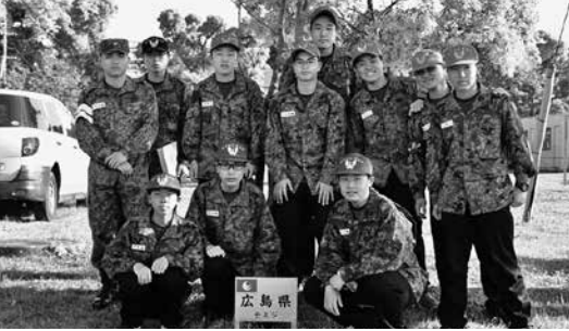
高等工科大学校広島県人会 (県木前にて)

ているので、初対面でも... 不安でいっぱいでした。しかし、先輩の丁寧な指導により、最初はできなかったことが少しずつできるようになったりしました。また、生活に慣れていくにつれ、同期と話すようになる、少しずつ打ち解けて会話を楽し... になりました。日々の生活は、忙しく大変ですが、同期とともに苦楽を共有し、困難を乗り越えていくなかで、自分の成長や同期との絆を感じられるようになりました。これまでの学校生活を通して、大切だと感じたことは、「同期を大切にすること」です。同期は、かけがえのない仲間です。