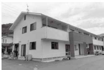
高齢者居宅介護施設工事 (民間)

建設業許可番号 広島県知事許可 (特-23) 第567号 一級建築士事務所 広島県知事登録 09 (1) 第4008号 ISO9001 平成14年3月8日登録