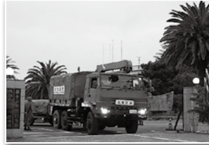
1月3日未明 能登半島地震災害派遣に出動する第13旅団 (海田市駐屯地)