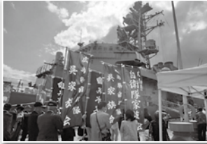
6月3日 アデン湾ソマリア沖海賊対処部隊「さみだれ」激励見送り (呉基地)