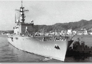
1月2日 呉基地を出港する「おおすみ」、翌3日舞鶴港にて救命・救援物資、陸自機材(ブルドーザ等重機)を搭載。