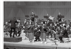
令和5年10月21日(土) 陸上自衛隊第13音楽隊と市立四季が丘中学校のコラボ演奏 (廿日市市ウッドワンさくらびあ)