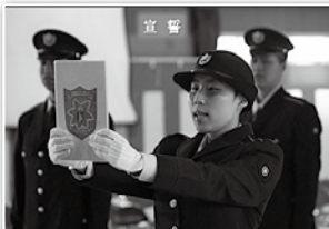
4月6・8日 第46普通科連隊・呉教育隊・海自幹部候補生学校入隊・入校式激励(写真は第46普通科連隊・海田市駐屯地)