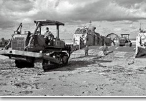
1月4日 輸送艦「おおすみ」エアクッション艇により、陸自機材・支援物資の陸揚げ開始