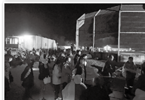
1月1日 航空自衛隊輪島分屯基地に約1,000名の避難住民を受け入れ