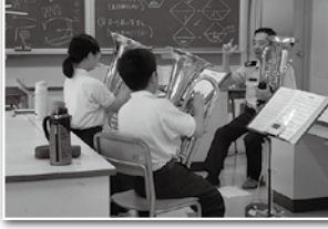
中学校吹奏楽部演奏指導要請。写真は7月23日 第13音楽隊による演奏指導 (廿日市市立野坂中学校)