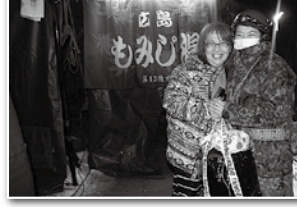
1月6日 第13後方支援隊等による海田市部隊による入浴・給食・給水等の生活支援開始 (輪島市珠洲市)