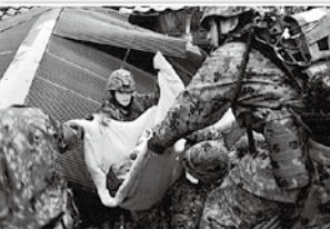
1月1日 地震直後瓦礫より市民3名の人命救助。その後救助・救援・生活支援・防疫活動等を実施