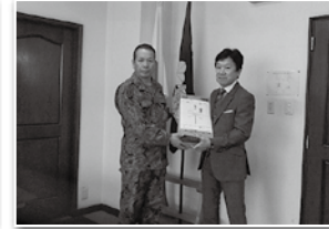
1月4日 能登半島地震災害派遣部隊激励 (海田市駐屯地)