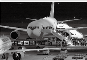
令和5年10月21日、11月3日 イスラエルから退避の邦人等129名を羽田空港まで輸送