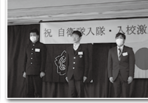
毎年2・3月 新隊員入隊入校激励会実施。写真は2月17日 西部地区様子 (阿品市民センター)