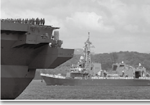
6月3日 呉基地出国のアデン湾ソマリア海賊対処部隊「さみだれ」を見送る「かが」隊員