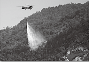
1月 江田市(大垣町)山林火災消火活動実施